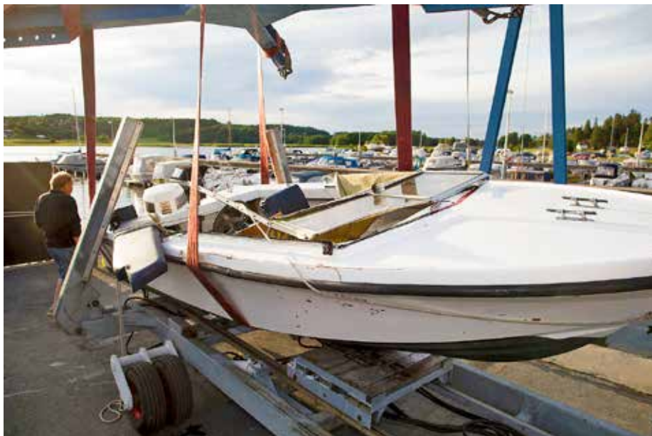
Skjeberg, Norge 20150717. Båt som ble truffet av gjerningsmann. Båtulykke ved Høysand Brygge i Skjeberg.