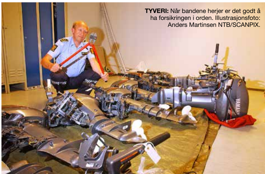
TYVERI: Når bandene herjer er det godt å ha forsikringen i orden.