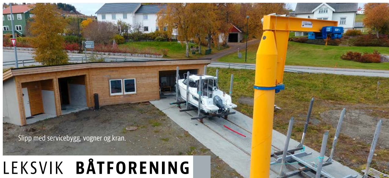
Slipp med servicebygg, vogner og kran.