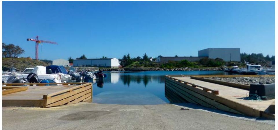
HER SEES FØRSTETRINN I oppgraderingen på Bystranden stå ferdig.