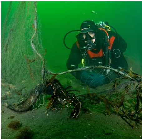
TAPTE FISKEREDSKAPER ER ET STORT PROBLEM FOR VERDENSHAVENE. Alle burde få krav om å rapportere inn dersom utstyr tapes på havet mener WWF Verdens naturfond.