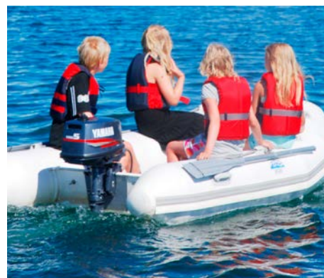
KNBFs egen medlems-app er god å ha når barna skal ut med jolla en klar høstdag.